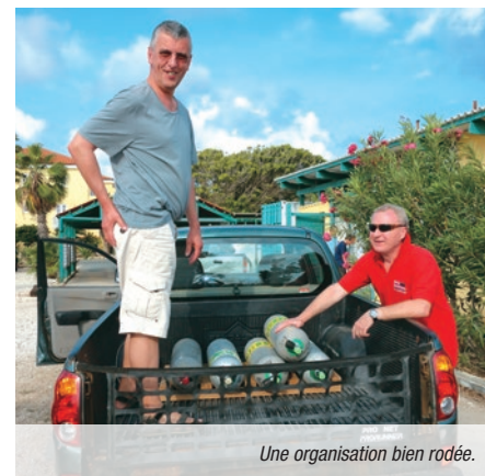
Une organisation bien rodée.

Bien sûr, aucun mouillage n'est possible dans une des situations, seul l'amarrage sur coffre positionné par les gardiens du parc est autorisé. ■