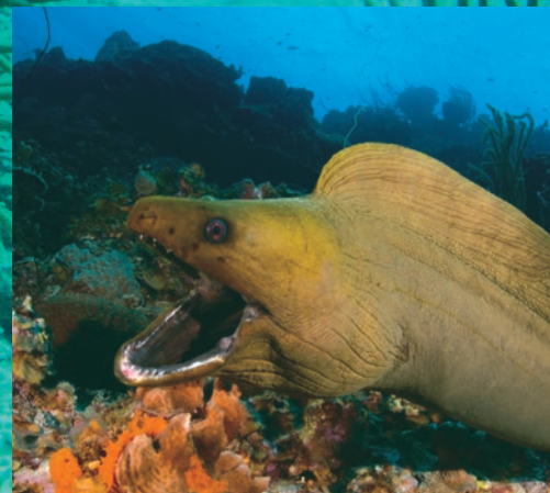
Les murènes sont de belle taille.