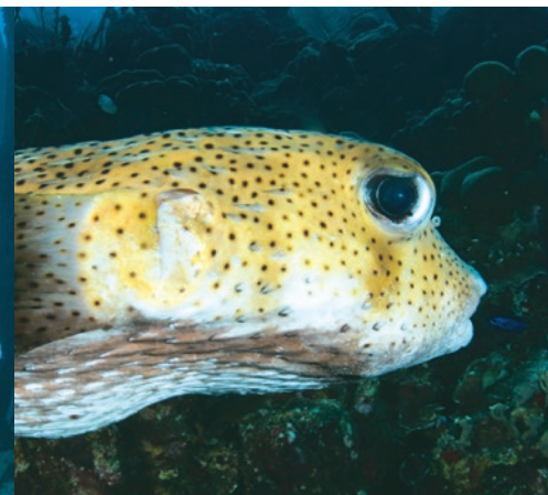
Le diodon est un poisson cosmopolite.