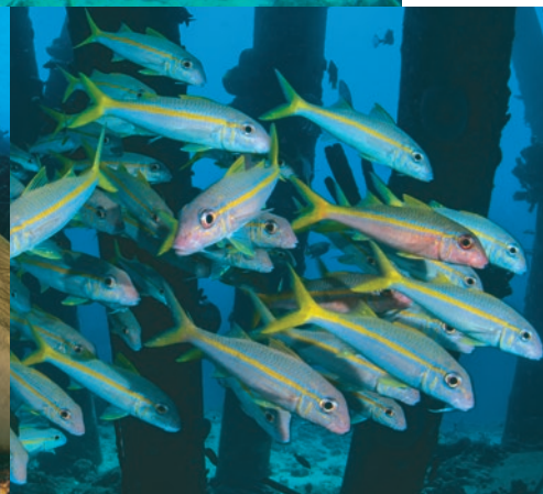
Les vivanex à queue jaune aiment la protection des pontons.