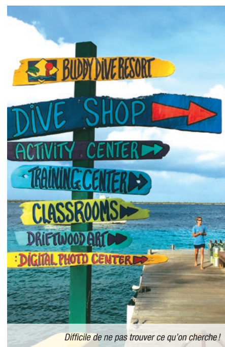
Difficile de ne pas trouver ce qu'on cherche !